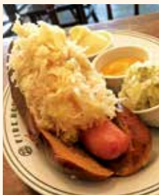
📍3種の味をお好みで加えることができるホットドッグ! 刺激的な味わいをぜひ!