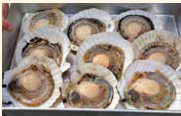
📍オホーツク紋別産殻付活ホタテ。他にも、野付産・利尻島産で一年中ご利用しています。