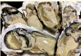
📍厚岸産を中心に、オホーツク常呂のサロマ湖産の牡蠣、仙鳳趾産の牡蠣をご利用しています。