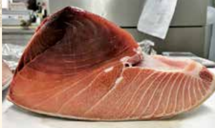
📍焼津港天然 インドマゴロ