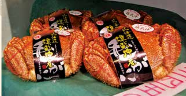
📍なんととってもオススメはカニと熟弁するご主人。季節ごとにオススメのカニをご提案!